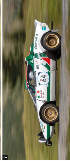
1 De Jaguar XK120 (die in 1953 bij het Belgische Jabbeke het snelheidsrecord op de openbare weg zette op ruim 277 km/h). 2 Alfa Romeo 52, vóór aan bij de Motorsport Rendez-vous. 3 Een Cooper Climax T-45, niet de berg op. 4 Passend vertoer voor deze Porsche 250 Spyder. 5 Gebouwd in de Alpen: een Shelby Cobra met bijna 427 cv in '68. 6 Daniele Petrucci preegt zijn Porsche 3.0 RSK uit 1994 in een recordtijd van 2:09,2 de Bernina-pas op. 7 Een Lancia Stratos in rally-aanpak, het blijft een prachtig gezicht.