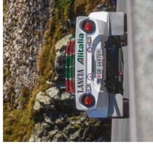
EN LANCIA STRATOS i klassisk Alitalia-bemaling på en bjergvej er måske den mest milde af alle muligheder, hvis man interesserer sig for rallyhistorie. Den lyder også godt!