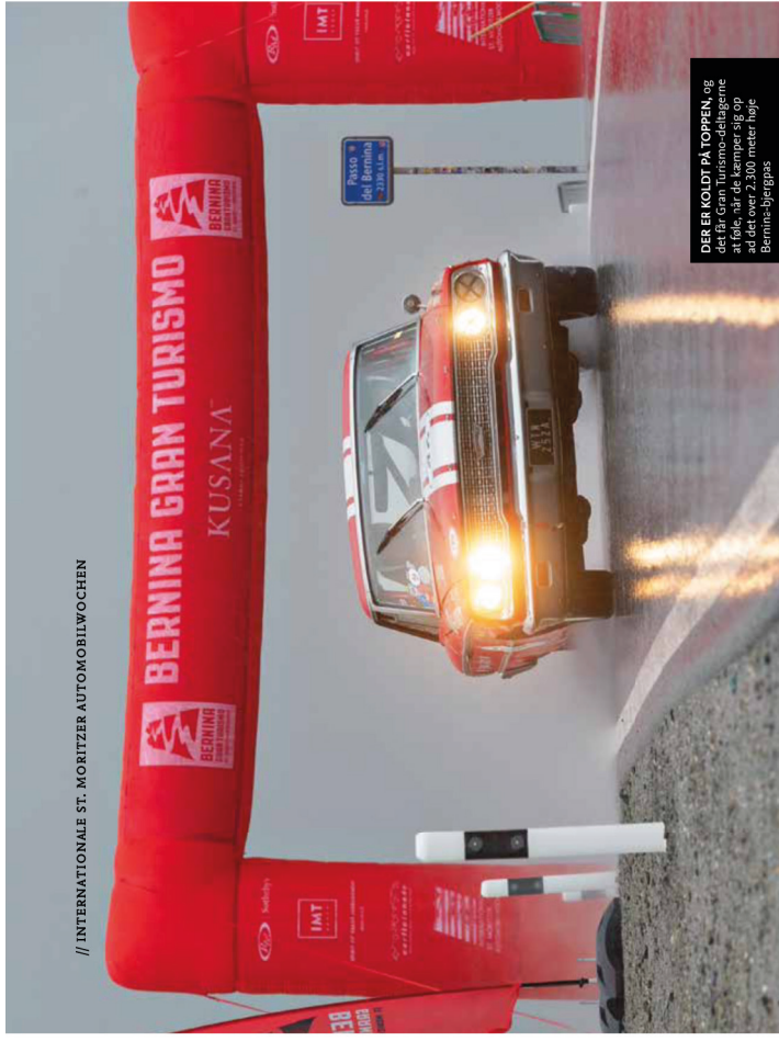
DER ER KOLDT PÅ TOPPEN , og det får Gran Turismo-deltagerne at føle, når de kæmper sig op ad det over 2.300 meter høje Bernina-bjergpas