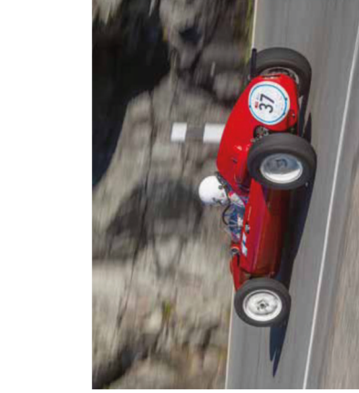
BREDDEN I FELTET ER IMPONERENDE – også en Cooper-Climax T45 Formel 1-racer fra 1958 tog bilen en tur op ad den 3,7 km lange Bernina-vej